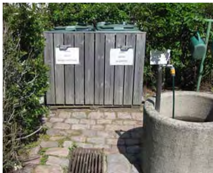
Det oppfordres til at besøkende på kirkegården kildesorterer i henhold til anvisning på avfallsstativene.

.... En sjettedel av verdens befolkning lever i dag uten tilgang til rent drikkevann, mens hver av oss nord-