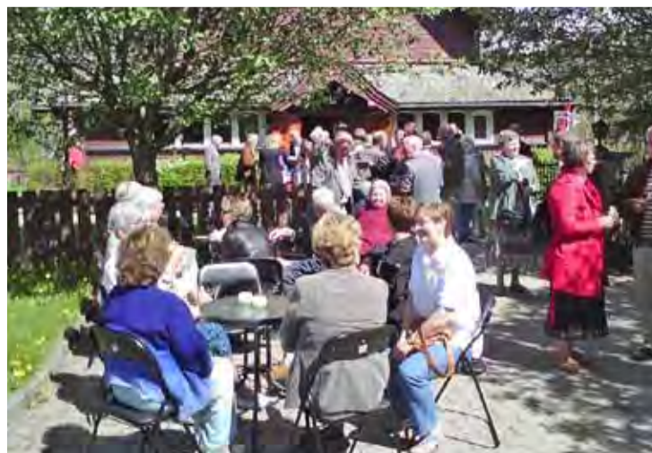
Kirkekafé: Mange satte pris på uteserveringen ved kirken første pinsedag.

Etter gudstjenesten var det mange blide mennesker å se på kirketrappen. Og festgudstjenesten ble avsluttet med gratis is og kaffe i utekaféen ved kirkeporten.