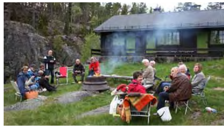
Akk, kjære mai hvor gjerne gad jeg i marken gå. Møteplass Mysen Menighet på utflykt til Kulevannssaga.

Slik oppsummerer vi sesongens siste Møteplass Mysen Menighet. En god gjeng hadde tatt turen til Kulevannssaga i Trømborgfjella. Vi takker for en givende vår og ser fram mot et innholdsrikt høstprogram. Velkommen til å slå følge med menigheten på spennende aktiviteter til høsten.